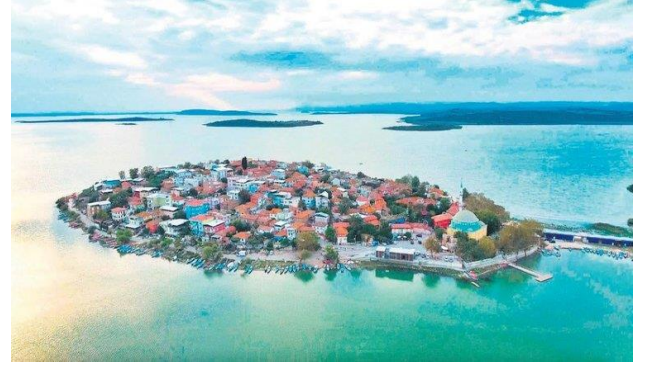
Gölyazı Köyü ( Bursa )