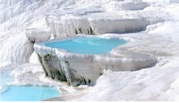
Pamukkale Travertenleri (Denizli)

İnsan eli değmeden oluşan ve gezilip görülebilecek özelliği olan yerlere doğal yerler denir.