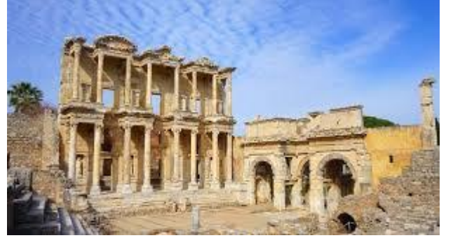
Efes Antik Kenti ( İzmir/Selçuk )