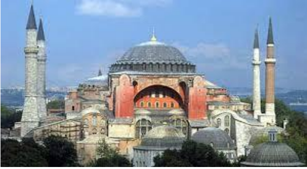
İstanbul Ayasofya Müzesi (Camii)

Geçmişte yaşamış insanlardan kalan yapı ve alanlara tarihi yer denir . Ülkemizde görülmesi gereken tarihi yerler :