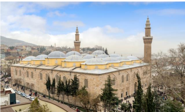
Bursa Ulu Camii