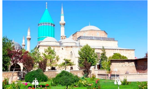
Konya Mevlana Müzesi