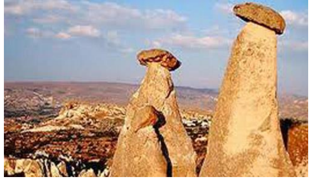
Peri Bacaları ( Nevşehir )