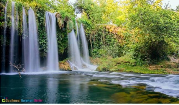
Düden Şelalesi ( Antalya )