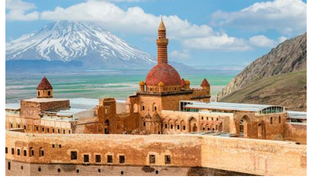
İshak Paşa Sarayı ( Ağrı )