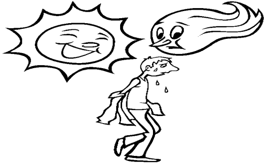
Rüzgâr ile Güneş

Güneş ve rüzgâr kimin daha güçlü olduğunu tartışıyorlarmış. Rüzgâr: -Ben daha güçlü olduğumu kanıtlayacağım. Şu karşıdaki paltolu yaşlı adamı görüyor musun? Paltosunu senden daha hızlı çıkaracağıma bahse girerim demiş. Güneş bir bulutun arkasına çekilmiş ve rüzgâr kasırga şiddetinde esmeye başlamış. O kuvvetle estikçe ihtiyar adam paltosuna daha sıkı sarılıyormuş.