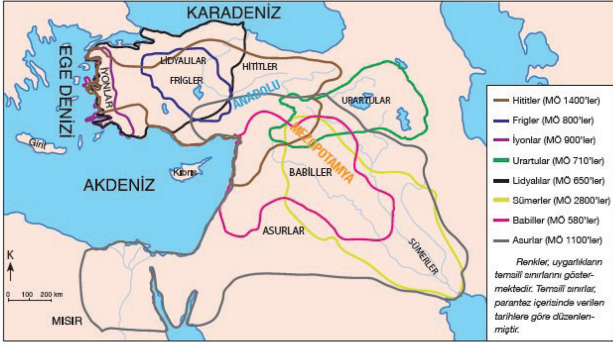
Anadolu ve Mezopotamya Uygarlıkları Haritası

Yukarıda verilen Anadolu ve Mezopotamya uygarlıklarına ait haritaya bakılarak;