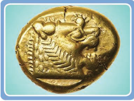
Lidyalılar döneminden kalma altın para