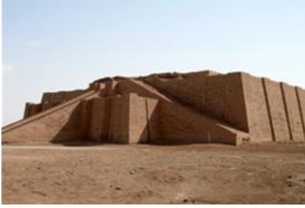
Irak'ta yer alan bir ziggurat.

Sümerler, MÖ 4000 - MÖ 2000 yılları arasında Mezopotamya’da kurulan ilk devlettir . Bu nedenle Sümerler, Mezopotamya’da kurulan uygarlıkların temelini atmıştır. Mezopotamya’da yazı ve astronomi ilk kez Sümerler döneminde ortaya çıkmıştır. Sümerlerde halk, Mezopotamya’da yaşamının sonucu olarak geçimini tarım ve hayvancılık yaparak sağlamıştır. Şehir devletleri olarak yönetilen Sümerlerde her şehirde ziggurat adı