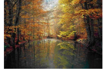
Yedigöller - Bolu

Başka bir doğal güzelliğimiz ise bünyesinde yedi adet gölü barındıran Bolu’daki yedigöllerdir. Burası farklı ağaç türlerine sahip zengin ormanı ve eşsiz bir doğa harikası ile görülmeye değer bir yerdir.