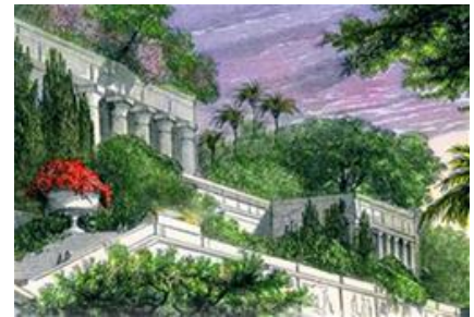
Babil’in Asma Bahçeleri’ni temsil eden bir resim.

Mezopotamya’da kurulan ilk Babil Devleti’nin kralı Hammurabi ; ceza, mülkiyet ve ticaret alanlarında döneminin en gelişmiş kanunlarını yapmıştır. Bu kanunlar, Hammurabi Kanunları olarak tarihe geçmiştir. Başlıca geçim kaynakları tarım ve ticaret olan Babiller, tıp ve astronomi alanında da ilerlemişlerdir. Mimari açıdan Mezopotamya’nın en gelişmiş uygarlığı olan Babiller, asma bahçeleriyle ün yapmıştır.