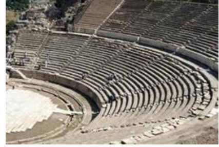
İyonyalılar tarafından İzmir'de inşa edilen Efes antik tiyatrosu.

Eski Yunan kavimlerinden biri olan Akalar , MÖ 12. yüzyılda Yunanistan'dan Batı Anadolu'ya göç etmişler ve İyon şehir devletlerini kurmuşlardır. İyonya olarak bilinen bu bölgede kurulan şehir devletlerinin aralarında siyasi bir birlik bulunmamaktadır. Akalar, kurdukları şehir devletlerinin yanı sıra Akdeniz ve Karadeniz kıyılarında, tarihte bir ilk olan deniz ticaret kolonilerini kurmuşlardır. Birçok bilimin temelini atıldığı İyonya'da Thales , Pisagor , Diyojen ve Hipokrat gibi ünlü isimler yaşamıştır.