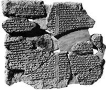
Asurlulara ait çivi yazıları.

MÖ 2000’li yıllarda kurulan Asur Devleti’nin başkenti Ninova’dır . Kuruldukları dönemde yaşadıkları coğrafyanın tarıma elverişli olmaması nedeniyle ticaret ve hayvancılıkla uğraşan Asurlular; Anadolu’da Kültepe, Alishar ve Boğazköy’de ticaret kolonileri kurmuşlardır. Bu koloniler aracılığıyla Asurlular, yazıyı Anadolu’ya taşımışlardır.