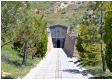
Kral Midas'ın Ankara Polatlı'daki mezarı.

İç Batı Anadolu'ya, Hititlerin yıkılmasının ardından Balkanlardan gelerek yerleşen Frigler, başkenti Gordion olan Frigya Devleti 'ni kurmuşlardır. Friglerin ilk kralı, başkentlerine adını veren Gordios 'tur. Frigler, yaşamı ve ölümü hakkında birçok mitolojik efsane yazılan Kral Midas döneminde en güçlü dönemlerini yaşamıştır. Ekonomileri tarım ve