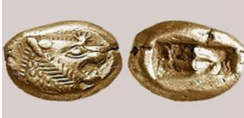
Lidyalılar dönemine ait altın para örneği.

MÖ 1200'lerde Gediz ve Küçük Menderes vadileri arasındaki bölgeye yerleşen Lidyalılar, Kral Giges Dönemi'nde devletlerini kurmuşlardır. Lidya Devleti'nin başkenti, Manisa'nın Salihli ilçesi yakınlarında bulunan Sardes antik şehridir. Ticaret alanında gelişmiş olan