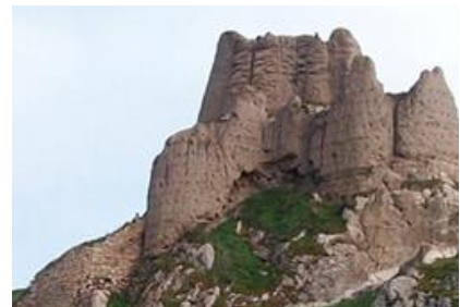
Urartular döneminde yapılan Van (Tuşpa) kalesi.

MÖ 13. yüzyıl ile 9. yüzyıl arasında Anadolu'da yaşamış olan Urartuların başkenti Tuşpa yani bugünkü adıyla Van 'dır. Urartu Devleti en güçlü döneminde; günümüzdeki Doğu Anadolu, Kuzeybatı İran, Irak'ın küçük bir bölümüyle kuzeyde Aras Vadisi'ne egemendi.