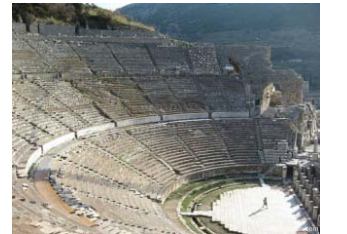
Efes Antik Tiyatrosu

Anadolu’da kurulan uygarlıklar, Anadolu’da birçok tarihi eserler inşa etmişlerdir. Örneğin; İzmir’in Selçuk ilçesindeki Efes antik kenti binlerce yıllık bir tarihe sahip olmakla birlikte, birçok uygarlığa da ev sahipliği yapmıştır. Efes; tiyatrosu, kütüphanesi, tapınakları ve sahip olduğu diğer yapıları ile geçmişin izlerini net olarak görebileceğimiz bir kenttir.