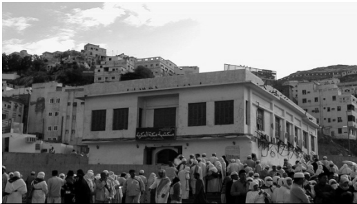
MEKKE'DE HZ. MUHAMMED (S.A.V)'İN DOĞDUĞU EV