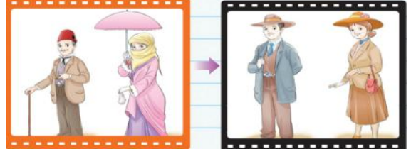
Kılık Kıyafet Kanunu