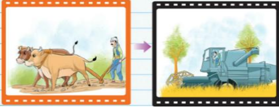
Tarımda makineleşmeye önem verilmesi