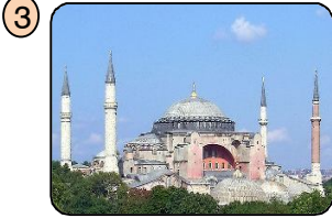
Ayasofya Müzesi İstanbul'da bulunur.