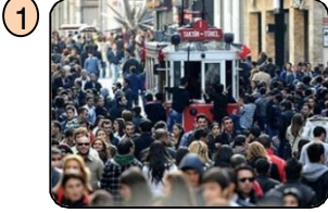
En kalabalık nüfuslu ilimizdir.