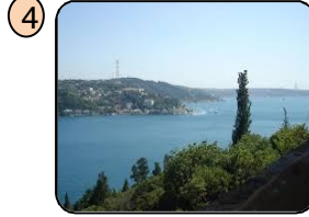
Boğaz'ın muhteşem halini herkes görmelidir.

Buna göre, Ertuğrul'un numaralandırılmış cümlelerinden hangisi görüş bildirir?