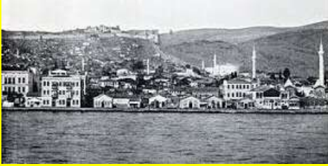
Mustafa Kemal'in dönemindeki Selanik