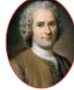
J. J. Rousseau