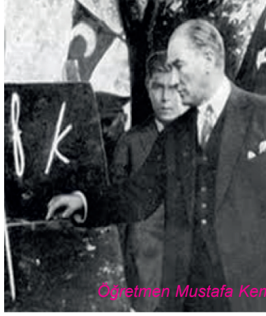
Öğretmen Mustafa Kemal