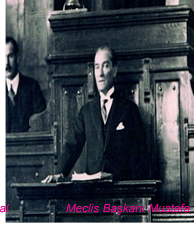
Meclis Başkanı Mustafa Kemal

Yukarıdaki görseller incelendiğinde Mustafa Kemal Atatürk'ün hangi kişilik özelliği ön plana çıkar?