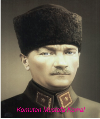
Komutan Mustafa Kemal