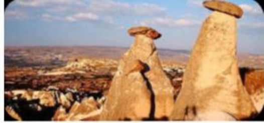
Kapadokya - Peribacaları