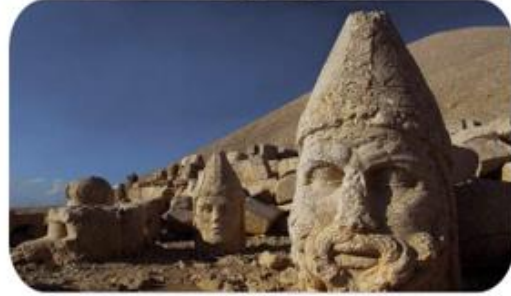
Nemrut Dağı ve heykelleri