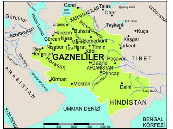
Harita 2: Gazneliler