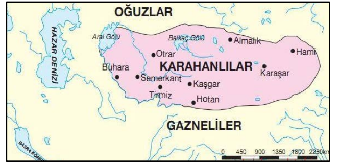
Harita 1: Karahanlılar