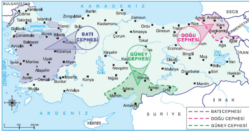
Harita: Milli Mücadele Döneminde Cepheler

Verilen harita dikkate alındığında aşağıdaki yargılardan hangisine ulaşamaz?