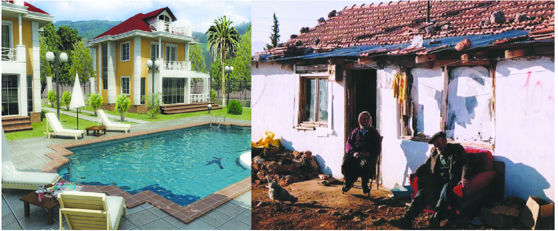
Resim 1.13: Kişilerin yasalar önünde eşit olması her zaman sosyal ve ekonomik bir eşitlik sağlamaz

Sosyal ve ekonomik hakların gerçekleştirilmesi amacıyla aktif görev üstlenen devlet anlayışı olan “ Sosyal Devlet ” 20. yy. da ortaya çıkmaya başlamıştır. Kavramsal anlamı bakımından sosyal devlet [Refah Devleti (Welfare State)]; vatandaşlarının sosyal durumlarıyla, refahlarıyla ilgilenen, onlara asgari bir yaşama düzeni sağlamayı kendine ödev edinen devlet olarak tanımlanabilir. Tanımdan da anlaşılacağı gibi sosyal devletin temel amacı, bir toplumu oluşturan bireylerin yasalar karşısında olduğu kadar, siyasal, sosyal ve ekonomik hayatın işleyişi içinde de eşit ve özgür olmalarını sağlamaktır. Sosyal devlet özel mülkiyeti ve hür teşebbüsü kabul eder, sosyal ve ekonomik demokratikleşmeyi gerçekleştirmeye yönelir.