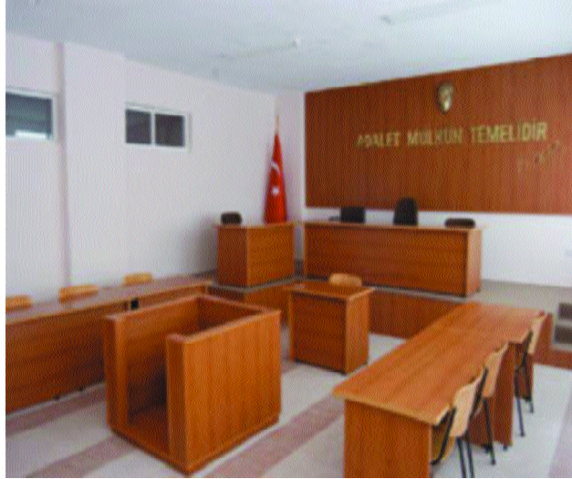
Şekil 1.12: Hukuk devletinde yargı bağımsızdır.

Hukuk devletinde yargı bağımsızdır. Makamı mevkii ne olursa olsun kimse mahkemelere emir ve talimat veremez. Mahkemeler anlaşmazlığı yasalara ve hâkimlerin vicdani kanaatlerine göre çözerler. Bu durum Anayasada “Hiçbir organ, makam, merci veya kişi, yargı yetkisinin kullanılmasında mahkemelere ve hâkimlere emir ve talimat veremez; genelge gönderemez; tavsiye ve telkinde bulunamaz.” ibaresiyle güvence altına alınmıştır.