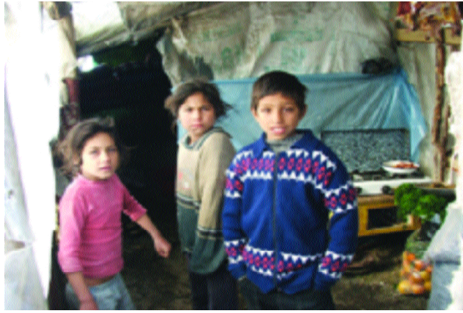
Resim 1.8: Ülkemizde çok sayıda çocuk çeşitli nedenlerle eğitim hakkından mahrum kalmaktadır.

Demokratik toplum düzeninin kurulması ve insan haklarının yaşama geçirilebilmesi için eğitim temel bir şarttır. Kişiler demokrasi bilincini ancak eğitim yoluyla kazanabilirler. Toplumdaki sosyal eşitsizlikler eğitim yoluyla azaltılabilir. Bu nedenle devlet için vatandaşlarına eğitim vermek bir görevdir. Her vatandaşın eğitilmeyi isteme hakkı vardır. Eğitim hakkı Anayasa'nın 42. maddesinde yer almıştır. Buna göre; “Kimse, eğitim ve öğrenim hakkından yoksun bırakılamaz ... İlköğretim, kız ve erkek bütün vatandaşlar için zorunludur ve Devlet okullarında parasızdır ... Devlet, maddî imkânlardan yoksun başarılı öğrencilerin, öğrenimlerini sürdürebilmeleri amacı ile burslar ve başka yollarla gerekli yardımları yapar. Devlet, durumları sebebiyle özel eğitime ihtiyacı olanları topluma yararlı kılacak tedbirleri alır...”