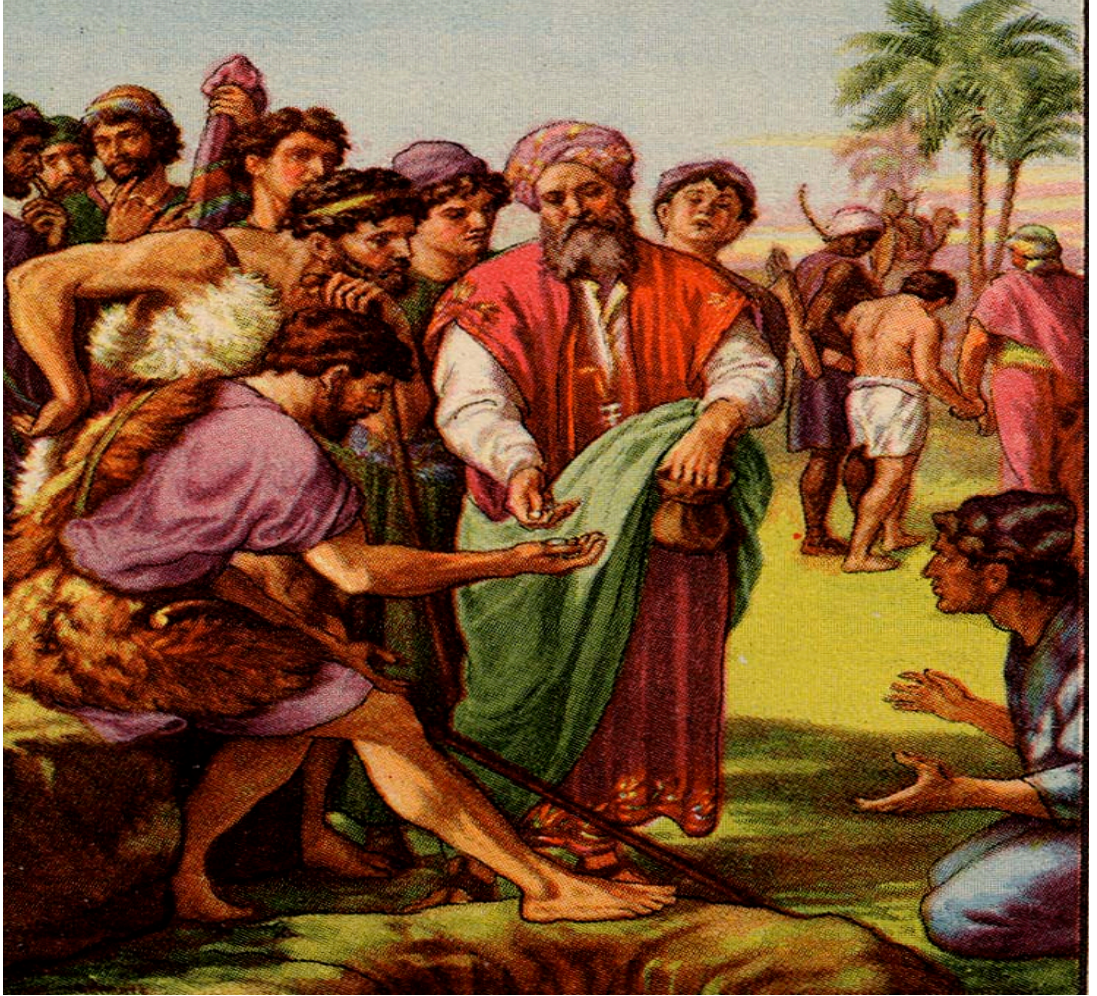
Resim 1.5: İnsan, yakın zamana kadar para ile satın alınabilen bir mal olarak görülmüştür.

İnsan hakları düşüncesinin temellerini çok eskilere götürmek mümkündür. Bu düşüncenin başlangıcıyla ilgili kesin bir tarih söylenemez. Tarihin her döneminde insanların birtakım haklara sahip olması gerektiğini söyleyen düşünürler muhakkak olmuştur.