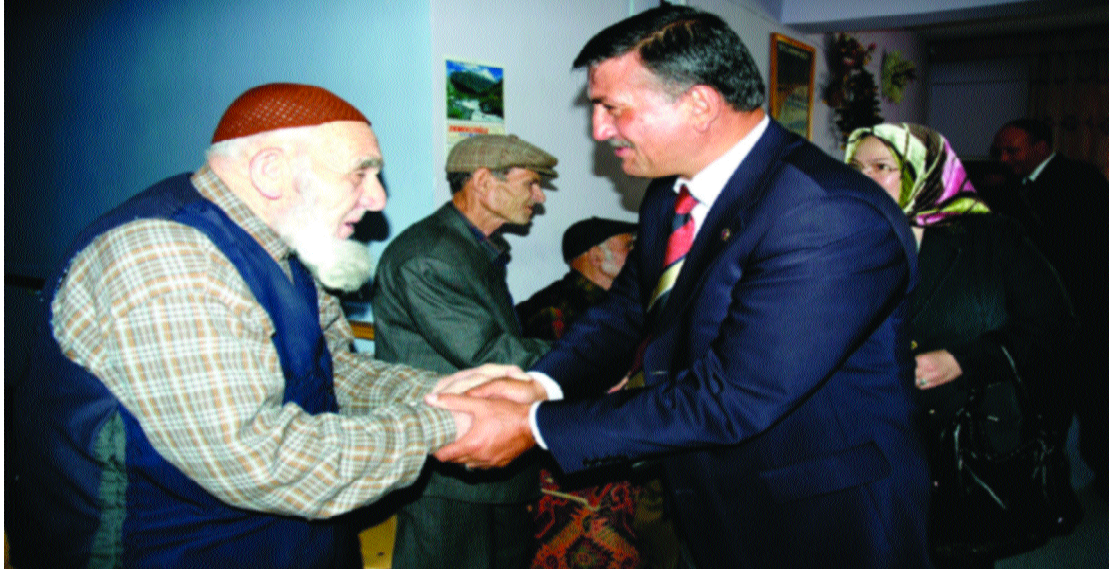
Resim 1.15: Sosyal devlet yardımı muhtaç yaşlılar için huzurevleri açar.

Ülkemizde Emekli Sandığı, BAĞ-KUR, ve SSK bu görevleri yerine getirmek için kurulmuş sosyal güvenlik kuruluşlarıdır. Sosyal Hizmetler ve Çocuk Esirgeme Kurumu, (SHCEK), Darülaceze, kadın sığınma evleri vb. kurumlarda bu amaçlarla oluşturulmuştur. Devlet bu görevleri bizzat gerçekleştirmenin yanı sıra bu amaçla kurulan vakıf ve dernekleri de desteklemelidir. Ülkemizde sosyal güvenliğin gerçekleşmesi amacıyla kurulmuş pek çok özel vakıf ve dernek bulunmaktadır.