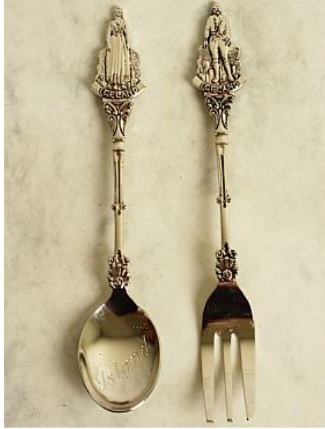
Resim 1.3: Eşitlik aynı olmak değildir

siyasî düşünce, felsefî inanç, din, mezhep ve benzeri sebeplerle ayırım gözetilmeksizin kanun önünde eşittir.