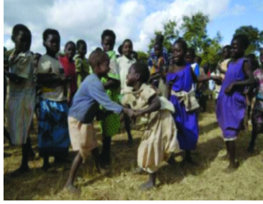
Resim 1.4: Bütün insanlar ırk ayrımı gözetilmeksizin belli haklara sahip olarak doğarlar.

İnsan hakları düşüncesinin temellerini çok eskilere götürmek mümkündür. Bu düşüncenin başlangıcıyla ilgili kesin bir tarih söylenemez. Tarihin her döneminde insanların birtakım haklara sahip olması gerektiğini söyleyen düşünürler muhakkak olmuştur.