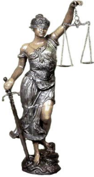
Resim 1.9: Adalet tanrıçası Themis

Amacı ve kapsamı bakımından hukuk sistemleri arasında farklılıklar bulunur. Hukuk sistemleri arasındaki bu farklılıklarda adalet anlayışının farklılık göstermesine neden olur. Söz gelimi herkese hak ettiği cezanın verilmesi gerektiğini savunan bir hukuk sisteminin adalet anlayışıyla hukuku sosyal bir koruma aracı sayan ve suç işleyenlerin ruhsal eksikliklerinin göz önüne alınması gerektiğini savunan bir hukuk sisteminin adalet anlayışı birbirleriyle çelişir durumdadır. Toplumca paylaşılan, çoğunluk tarafından kabul edilen şeylerin adalet olduğu savunulabilir. Fakat bu çoğunluğun adaleti olmaktan öte gidemez.