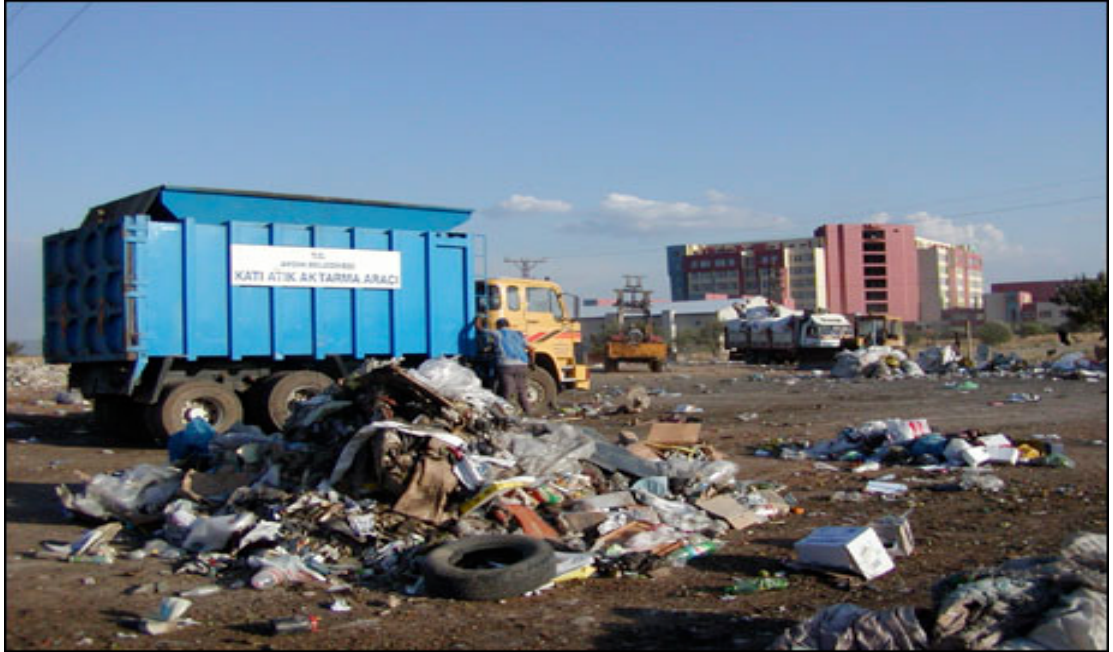
Resim 1.7: Herkesin temiz ve sağlıklı bir çevrede yaşama hakkı vardır.

Çevreyi geliştirmek, çevre sağlığını korumak ve çevre kirlenmesini önlemek Devletin ve vatandaşların ödevidir.”