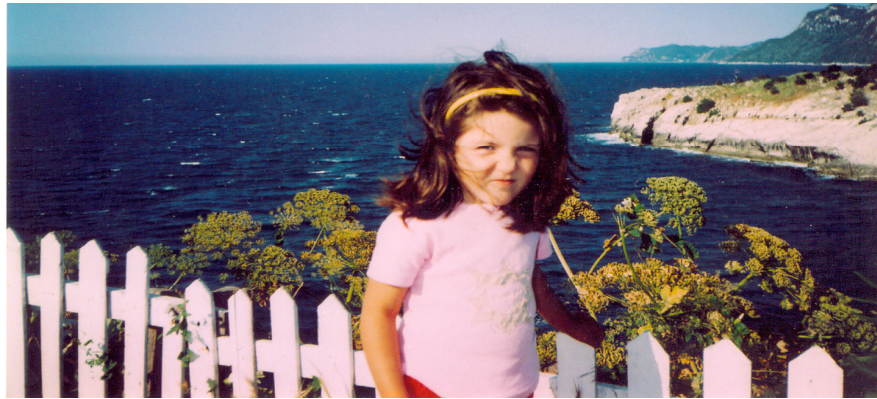
Resim 1.6: Herkes yaşama hakkına sahiptir.

Yaşama hakkı kişilerin en temel haklarından biridir. Yaşama hakkından mahrum olan biri diğer haklarından yararlanamaz. 1982 Anayasası'nın 17. maddesinde “Herkes, yaşama, maddî ve manevî varlığını koruma ve geliştirme hakkına sahiptir.” ifadesiyle yaşama hakkı anayasal güvenceye kavuşturulmuştur. 2004 yılında yapılan Anayasa değişikliğiyle maddenin devamındaki istisna hallerinden “mahkemelerce verilen idam cezalarının infazı” ibaresi çıkartılarak idam cezası da kaldırılmış, böylece yaşama hakkının önündeki engeller tamamen kaldırılmıştır.