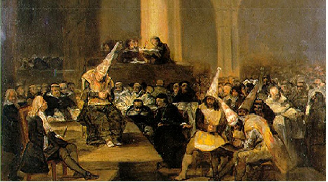
Resim 1.10: Engizisyon mahkemesi

Kilisenin halk üzerindeki egemenliğini devam ettirebilmesi ancak halkın cahil kalmasıyla mümkün olabilirdi. Eğitimli, düşünen, sorgulayan, araştıran ve farklı fikirler ortaya koyabilen bir halk, kilise için tehlikeliydi. Kutsal kitabı okuyup anlayabilen insanlar, dinin ruhban sınıfının kendilerine öğrettiklerinden farklı olduğunu görüp kiliseye karşı gelebilirlerdi. Bu nedenle kilise sistemli olarak her türlü eleştirel ve sorgulayıcı düşüncenin üstüne gitmiş, kilisenin istediğinden farklı düşünenleri ortadan kaldırmaya çalışmıştır. 10. yy. dan itibaren bu nedenlerle Aforoz (dinden çıkarma) müessesesi ve Engizisyon Mahkemeleri ortaya çıkmış, kilisenin düşündürmek istediğinden farklı düşünen herkes Engizisyon Mahkemelerinde yargılanarak ağır cezalara çarptırılmıştır.