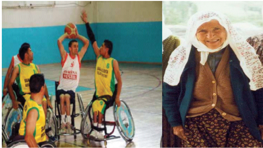
Resim 1.14: Engelliler ve yaşlılar yoksulluğa düşmeden yaşama hakkına sahiptirler.

Toplumdaki bireyler çalışarak kendilerinin ve ailelerinin geçimi için gerekli olan geliri elde edebilirler. Fakat kişiler çeşitli nedenlerle hayatlarının belli dönemlerinde çalışamayabilirler. Söz gelimi kişi hastalanmış, iş bulamamış, çalışmayacak kadar yaşlanmış olabilir. Ailesi olmayanlar, yaşlı ya da kimsesizler olabilir. İşte böyle durumlarda kişilerin yoksulluğa düşmeden yaşamlarını devam ettirebilmeleri için gerekli sosyal kurumların kurulması ve işletilmesi de sosyal devletin görevidir. Devlet çalışma yaşını ve yılını tamamlayanları emekliye ayırır ve emekli maaşı öder. Çalışma sırasında sakatlanan ve çalışmayacak duruma gelenlere sakatlık aylığı bağlar. Çalışanları öldüğünde eş ve çocuklarına bakar. Gazi ya da şehitlerin ailelerine bakar. Sakatlara, düşkünlere, yetim ya da terkedilmiş çocuklara bakmak için gerekli çalışmaları yapar. İşsizlere iş bulur. Bazı gelişmiş ülkelerde iş bulamayanlara maaş bağlar.