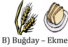
B) Buğday – Ekmek