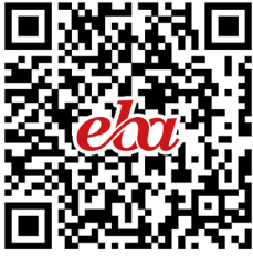
Okulumuzun Bölümlerini Tanıyorum

Uyum sürecinde faydalanabileceğiniz e-içeriklere okutarak ya da tıklayarak ulaşabilirsiniz.