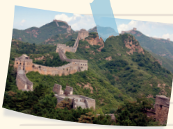
The Great Wall of China

A super long wall in China that was built a really long time ago to protect against enemies. I spent five hours to see it. It's the most amazing place I have ever seen.