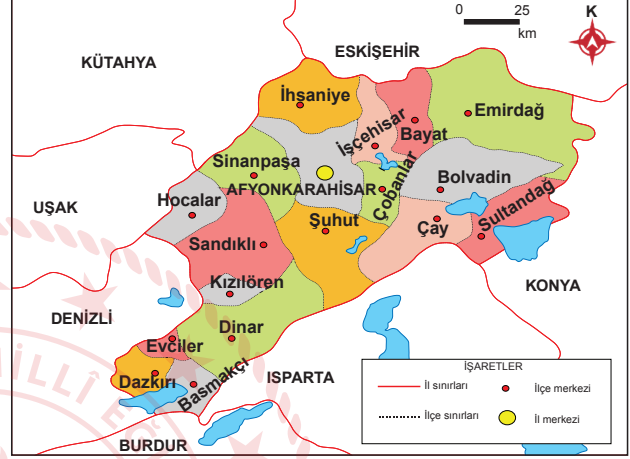
Afyonkarahisar ili idari haritası

a) Afyonkarahisar ilinin yeryüzü şekillerine iki örnek veriniz. Bu yeryüzü şekillerini hangi haritadan tespit ettiğinizi yazınız.