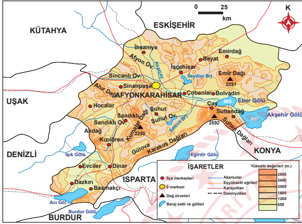
Afyonkarahisar ili fiziki haritası

4. Afyonkarahisar ilinin aşağıdaki fiziki ve idari haritalarından yararlanarak soruları cevaplayınız.