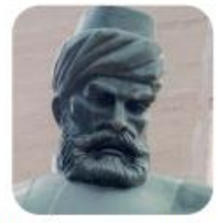
Sütçü İmam - Maraş