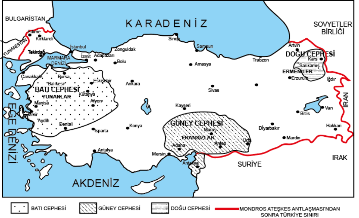
Milli Mücadele'de Doğu, Batı ve Güney Cepheleri

Milli Mücadele'de Doğu, Batı ve Güney Cephelerini gösteren haritadan aşağıdaki bilgilerden hangisine ulaşamaz?